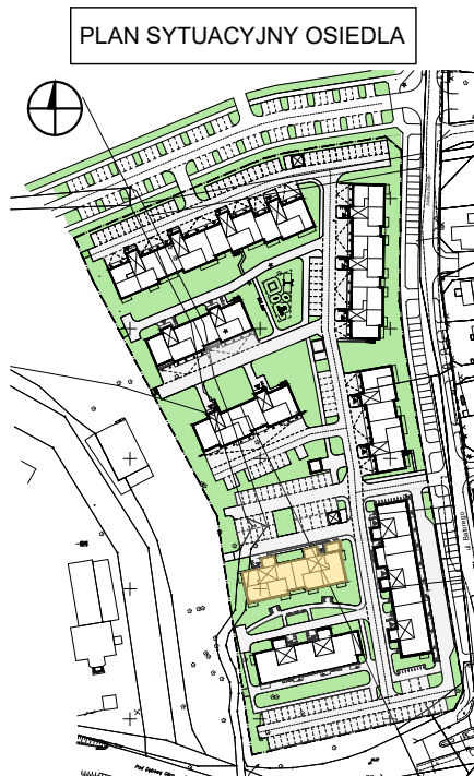
LOKALIZACJA MIESZKANIA ORAZ KOMÓRKI LOKATORSKIEJ