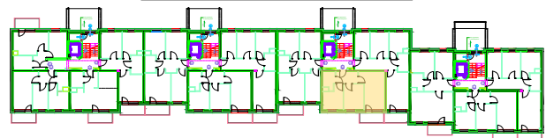
LOKALIZACJA KOMÓRKI LOKATORSKIEJ