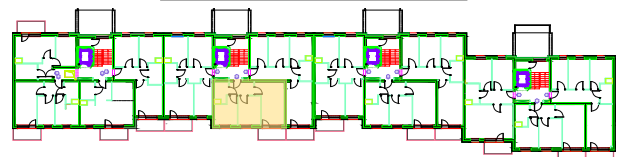
LOKALIZACJA KOMÓRKI LOKATORSKIEJ