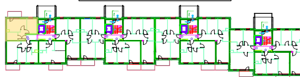
LOKALIZACJA KOMÓRKI LOKATORSKIEJ