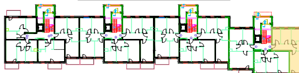
LOKALIZACJA KOMÓRKI LOKATORSKIEJ