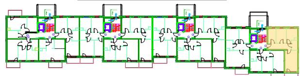
LOKALIZACJA KOMÓRKI LOKATORSKIEJ