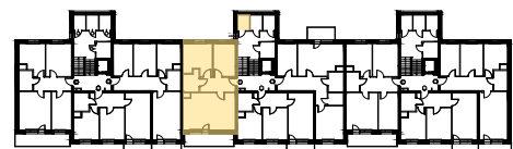
LOKALIZACJA MIESZKANIA ORAZ KOMÓRKI LOKATORSKIEJ

POWIERZCHNIE LICZONE WG NORMY PN-ISO 9836:2015